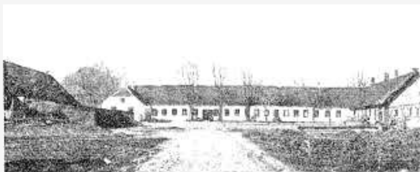
Kornumgaard set fra Indkørselsporten 1910