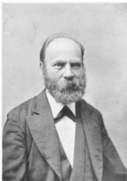
Evald Tang Kristensen