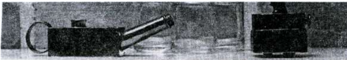
Et djævelsk instrument, der har været brugt af jordemoderen i Jerslev til åreladninger, Instrumentet står på sine syv knive. Til venstre spritlampen og i midten de glas, der hører til.