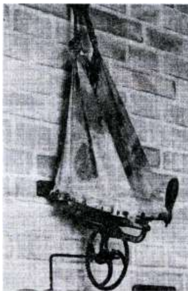
Den moderne såmaskines forløber og overgangsstadiet fra håndsåning til maskinsåning