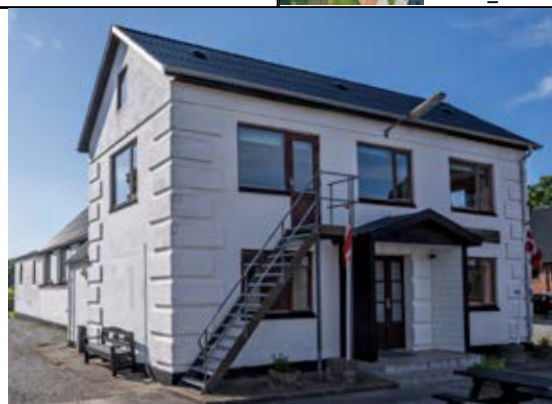
Liljevej 29 · Sterup · 9740 Jerslev

BELYSNING Belysningsforslag Energiberegning